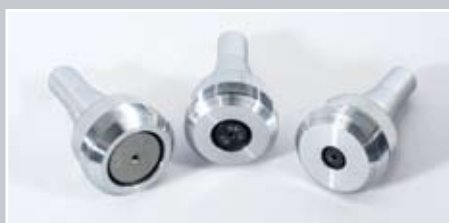
Strumenti di marcatura di prima qualità

La testa di marcatura ad ago è montata su un banco stabile con colonna regolabile in altezza. L'altezza regolabile mediante un volantino viene visualizzata digitalmente. Ciò semplifica l'impostazione della giusta posizione.