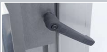
Possibilità di bloccaggio mediante leva di bloccaggio