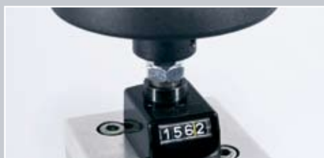
Visualizzazione altezza digitale